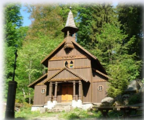
Tussetkapelle bei Stožec

Reiseziel: Rožmberk Termin: 10.-12. Juni 2024